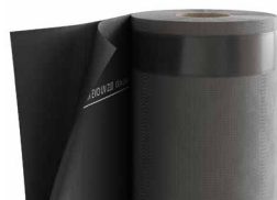
TRASPIR EVO UV 210